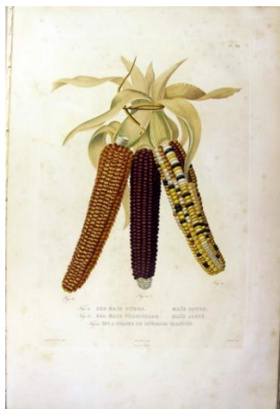
Mais jaspé, rosso e a grani di colori diversi (calcografia ad acquerello), da Bonafous, Histoire naturelle, agricole et économique du maïs , Paris-Tourin 1836.