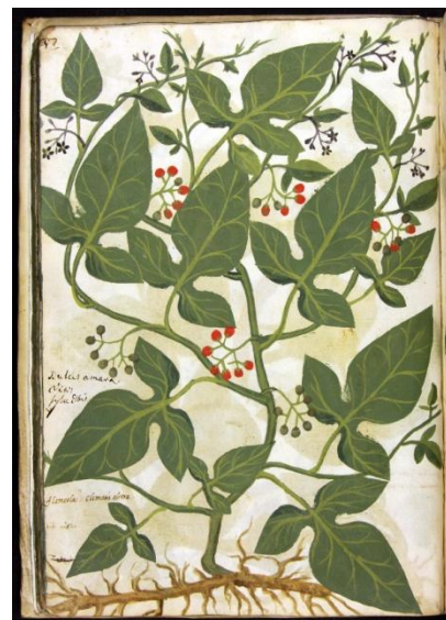
Vite selvatica (tavola dipinta), da Plantae medicinales de la Specieria di S. Francesco , MS.1969