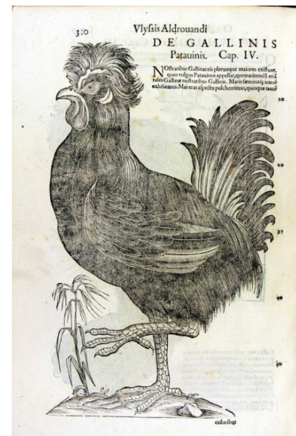
La gallina padovana (calcografia), da Aldrovandi, Ornithologiae , Bologna, 1599-1603.

La cultura è il cuore dell'Europa. Ritualità e storia della alimentazione attraverso l'arte italiana.