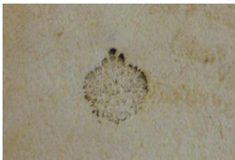
Timbro con aquila bicipite della Natio Germanica, su legatura di volume del 1650.

Alcuni di quei volumi si trovano oggi nella Biblioteca Universitaria, riconoscibili da note di possesso o dichiarazioni di dono, e ci testimoniano le esperienze di giovani orgogliosi di appartenere alla propria comunità nazionale e desiderosi di riunirsi, in amicizia e fratellanza, con i compagni di studi. Studenti da tutta Europa, alcuni dei quali mantennero legami duraturi con Padova.